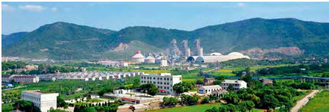
中材安徽水泥循环经济园远景