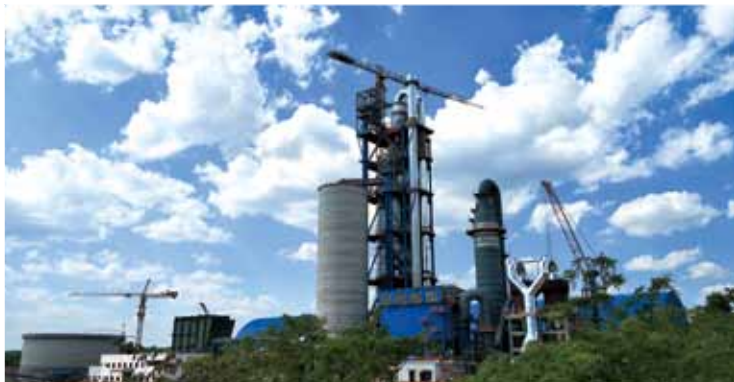
中国建材赞比亚工业园