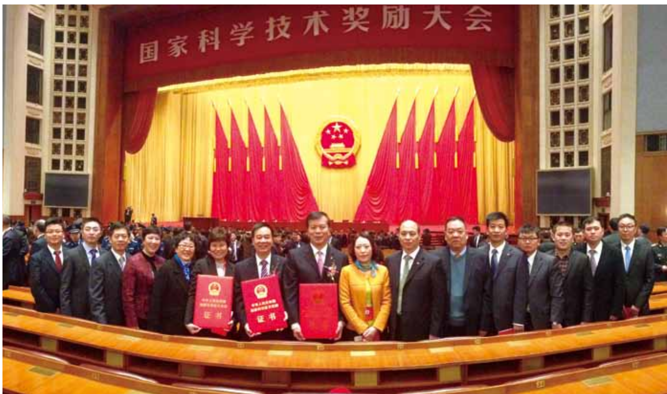
中国建材高性能碳纤维实现产业化技术成果荣获国家科技进步一等奖