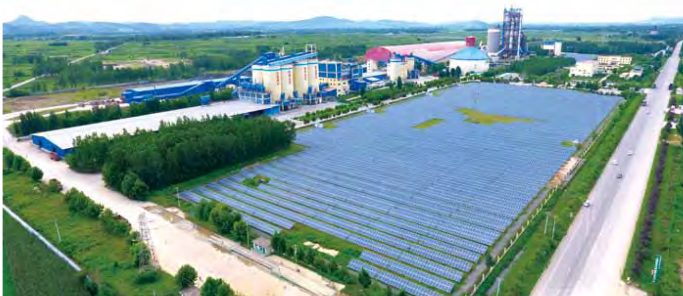
临沂中联打造的新能源水泥厂全景图