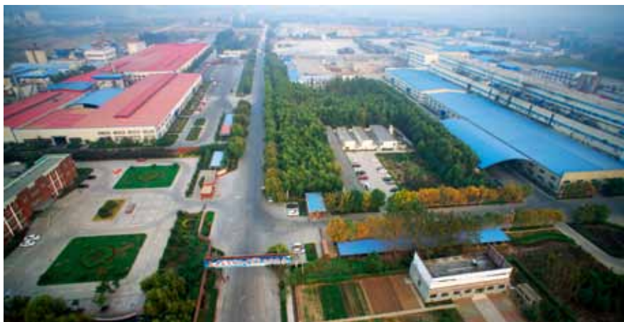
现代化的工业园区

些小石膏矿进货，但守着聚宝盆不能用还要到外边进货实在让人心有不甘，更难的是全厂几百名职工的生计。