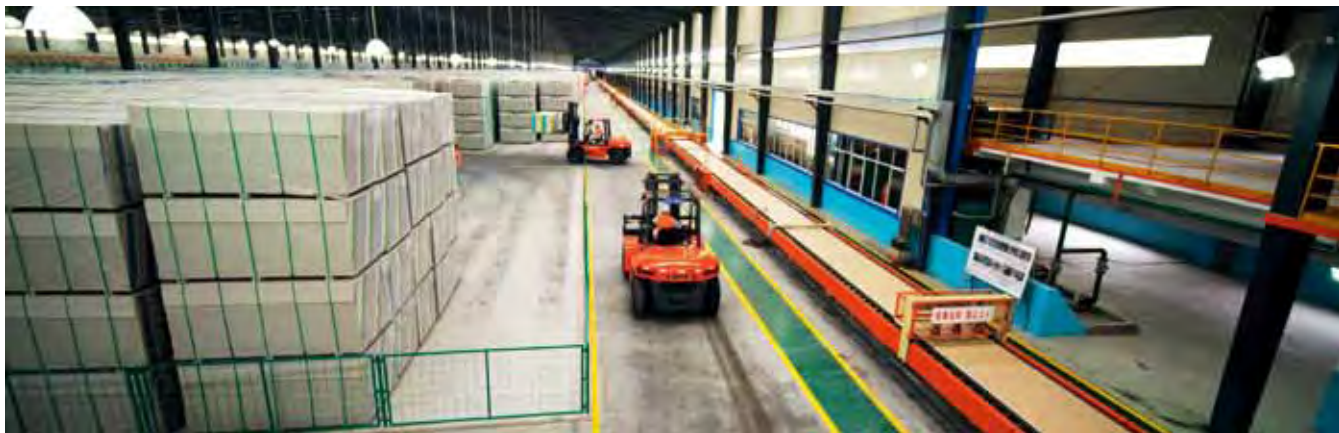
全国最大的现代化石膏板生产线

1992年，厂区石膏矿发生了严重的透水事故，泰山石膏的聚宝盆被淹没了，而根据当时技术手段，这类透水事故基本无解。据公司的老职工讲，没了矿等于没了进项儿，虽然可以从周边一