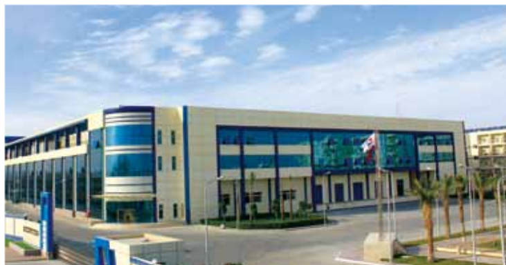
埃及年产20万吨玻纤生产基地

出3年来的一件大事，就是“一带一路”国际合作高峰论坛成功召开，全世界的目光都汇聚在首都北京，宋志平作为央企代表参加了论坛。在论坛召开期间，中国建材集团所属凯盛科技与哈萨克斯坦奥尔达玻璃公司签署了日熔化600吨浮法玻璃项目合同，同时签署全面合作战略协议。此次签约的玻璃项目是去年两国领导人会晤时达成的合作意向，在高峰论坛期间落地签约意义重大。