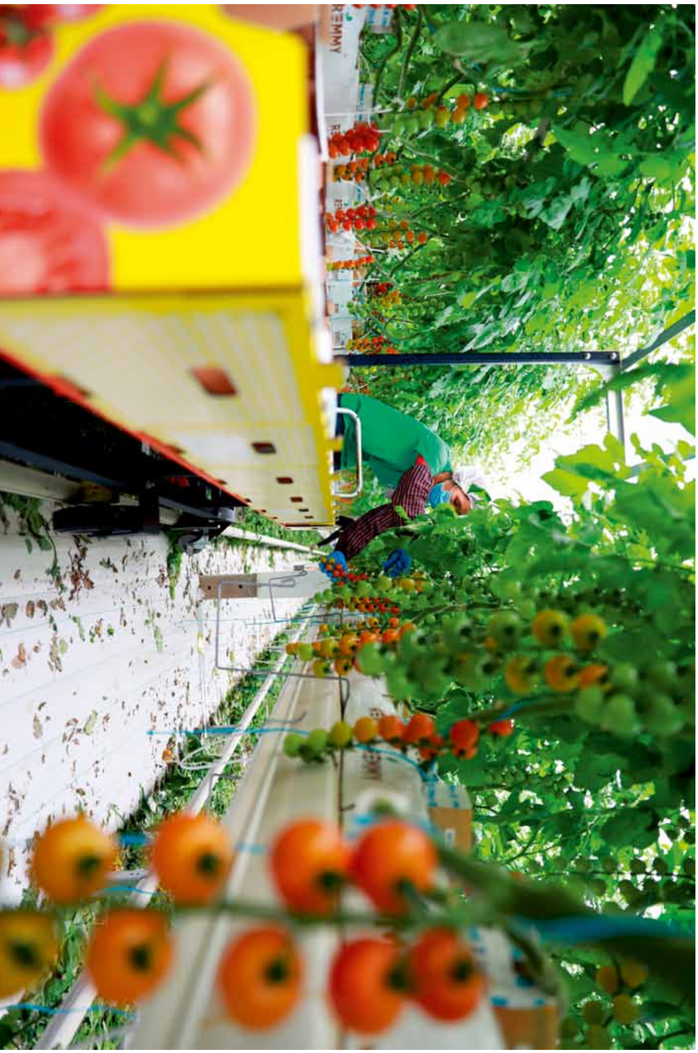
丰收 (凯盛浩丰德州智慧农业大棚)