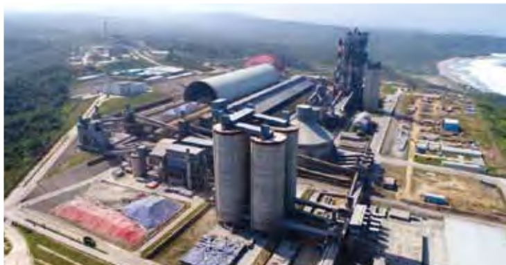
建设的印度尼西亚日产万吨水泥生产线