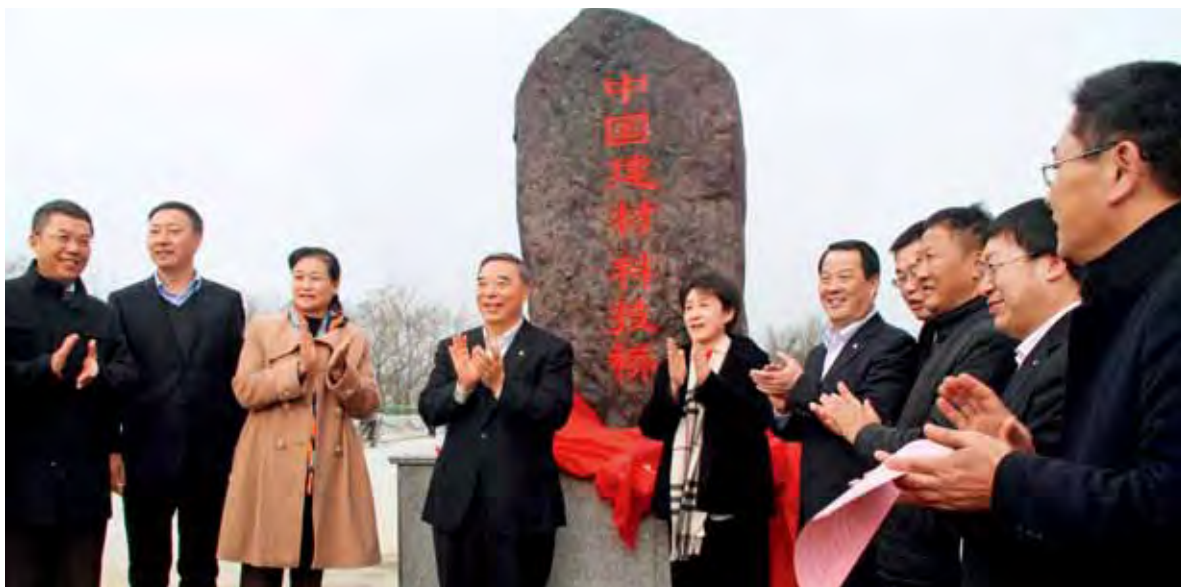
积极参与扶贫工作。图中是为安徽省石台县小河镇援建的“中国建材科技桥”竣工通车

除了这些贫困区域和自然灾害，在我们周围还有不少弱势群体，如孤儿、孤寡老人和艾滋病患者等，也需要社会大众的关心和帮助，企业和企业员工应该献上一片爱心。同时，通过这些爱心活动提升自己的人生观和价值观，企业员工会更珍视工作和热爱企业。