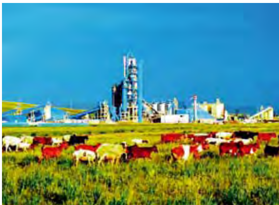
将保护环境放在首位。 图中是在蒙古国投资建设的“草原上的工厂”

在企业品格中，保护环境应放在首位，大多数企业在运行中都会耗费能源和资源，都会对环境产生一定的负荷，但随着企业的增多，能源、资源和环境都会不堪重负。人类在上个世纪七十年代首先认识到能源和资源的不可持续性，提出了可持续发展的理念，核心是发展可撑得住的经济，但到上世纪九十年代，人类发现了危及其发展的更大问题，就是气候变暖的问题，人们认识到，如果不控制温室气体的排放，人类将面临灭顶之灾。除了这些，企业的生产行为往往还会对土壤、水源和大气造成污染。