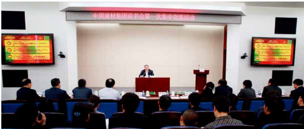
积极打造学习型组织，定期组织开展读书会交流活动。图中是宋志平参加读书会分享读书心得

企业的文体活动也很重要，对于员工的精神愉悦，健康员工的身心必不可少。中国建材旗下的北新建材每年都组织企业文化节和运动会，让员工展现才华，促进和谐，管理层和员工比赛篮球，密切干群关系。员工的身体健康也是重要的事情，要认真安排员