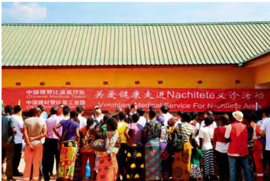
中国建材赞比亚工业园主动承担社会责任，为当地居民义诊

中国建材集团积极参与国际交流，宋志平董事长当选国际水泥协会创始主席，定期与世界500强建材企业沟通，成功举办国际水泥化学大会，建立亚洲水泥与混凝土研究院，坚持组织参加水泥、玻璃、陶瓷、玻纤等国际性峰会，在全球建材领域的话语权稳步提升。