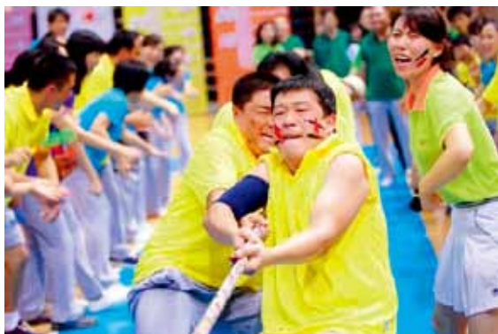
重视员工发展，积极开展文体活动

在企业中最宝贵的是员工，而不是机器和厂房。企业员工不是干活的机器，不能只是干活、吃饭、发奖金，要把企业作为员工的乐生平台，让大家在这个平台上充分发挥自己的聪明才智。有品格的企业善待员工，不只是因为竞争力的需要。企业应当成为员工自我实现的有效工具。要注重员工的全面发展，加强员工的学习培训，开展员工的拓展训练，丰富员工的文化生活，关心员工的身心健康，使员工德、智、体全面发展。