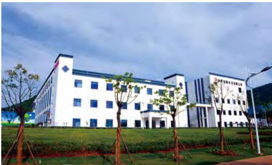
中材安徽水泥协同处置生活垃圾项目

新集团成立之后，企业最大的感受就是：全新的中国建材集团将原来两大企业的优秀文化融合在一起，经过提炼之后更加清晰和深远，注入了更丰