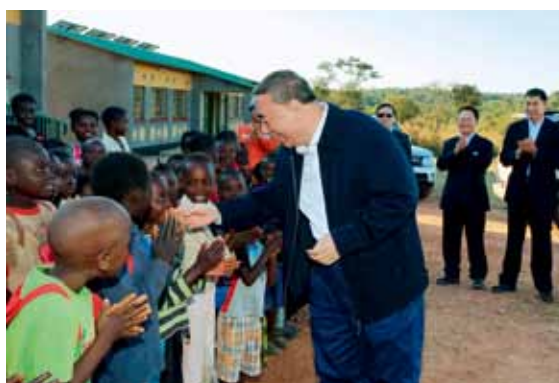
积极履行世界公民责任,在赞比亚援建了医院和小学。 图中是宋志平看望小学老师和学生

除了要办好公益事业之外,一个重要的事情是要和当地的企业合作,为当地培训员工,提高当地人员的技术和管理水平,实现合作双方的互利共赢。中国建材在土耳其建设大型水泥企业时,提出了“为当地经济做贡献、与当地企业合作、与当地人民友好相处”三原则,受到当地政府和企业的欢迎。赞比亚副总统听我讲述这三项原则时,高兴地说,“这就放心了,我们非常欢迎中资企业来赞比亚,但又担心挤垮本地企业,像中国建材这样和本地企业合作,我们政府非常欢迎。”在合作培训之外,中国建材还安排当地员工来中国国内工厂学习培训,增加了当地