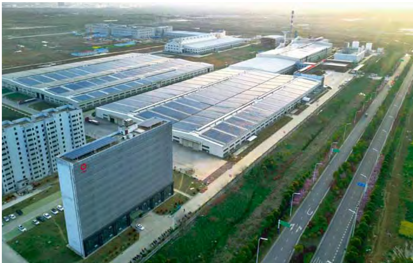
中建材(合肥)新能源有限公司全景