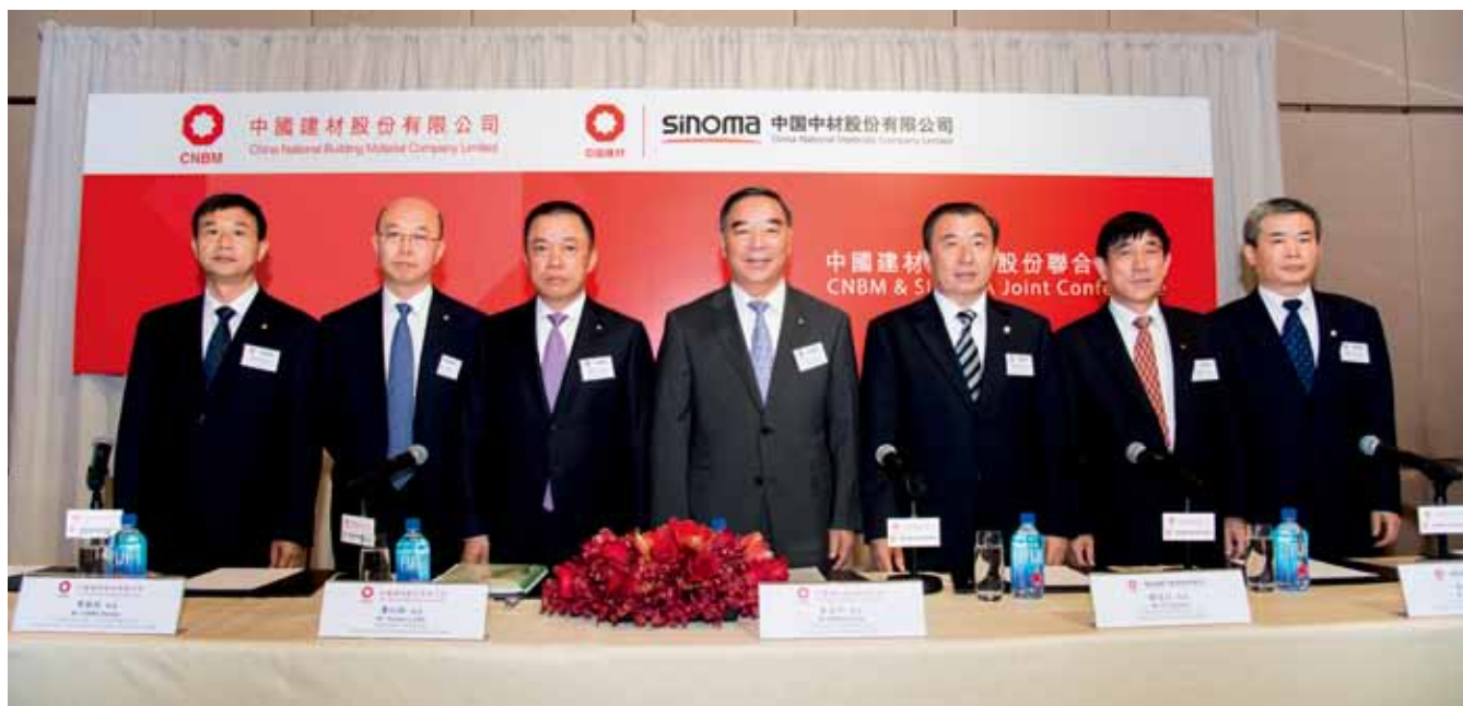
宋志平率领两家H股上市公司管理团队在香港召开联合发布会